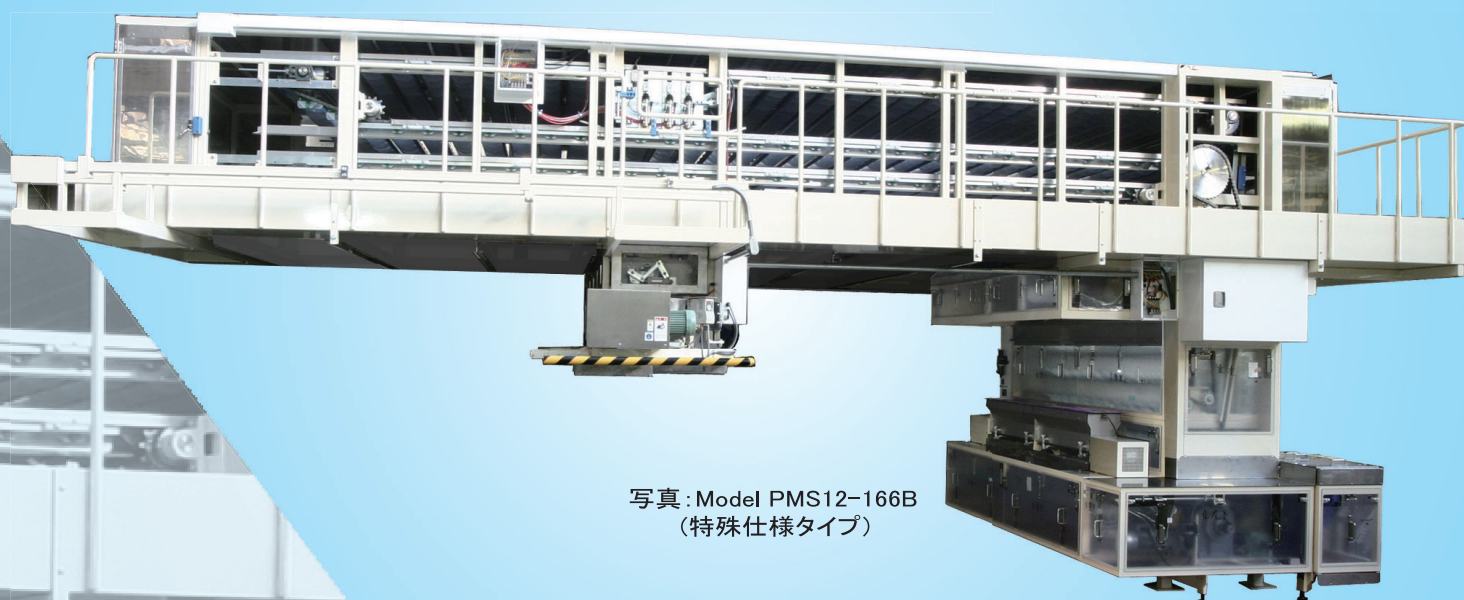
写真: Model PMS12-166B (特殊仕様タイプ)

生地玉を成形に適した生地状態にするため、短時間で生地を発酵させ組織の回復をはかる食パン専用のプルーフアです。