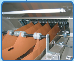
简单的出口输送机部 单触交换式分配板