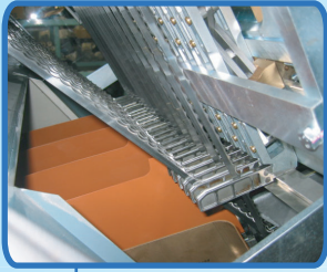
坚固的刀框 导轨部