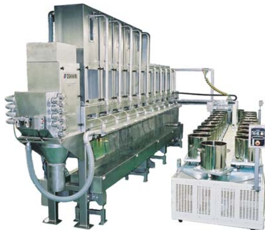
オプションフル装備機