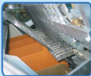
坚固的刀框 导轨部