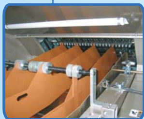
简单的出口输送机部 单触交换式分配板