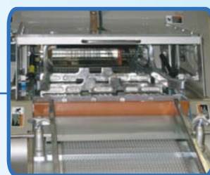
带安全防护 入口输送机